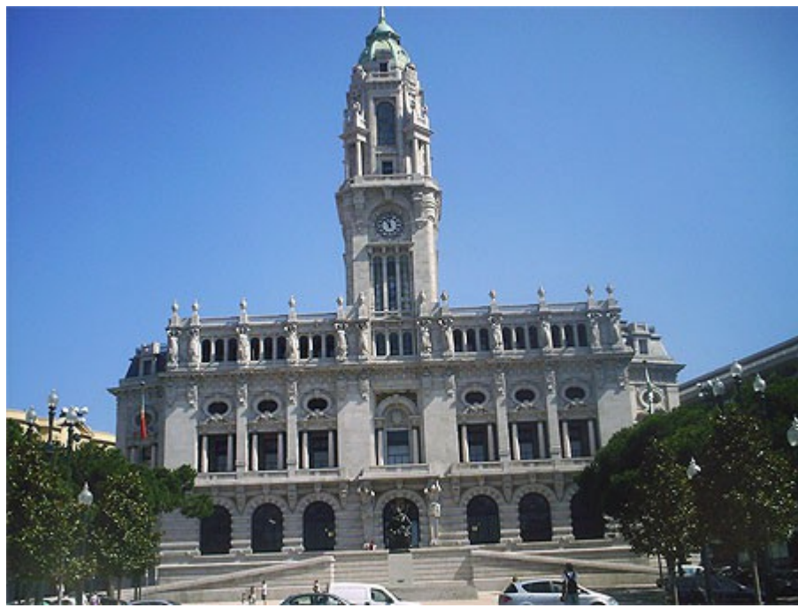
Camara Municipal do Porto