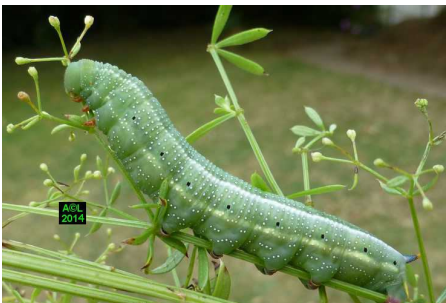
Chenille du moro sphinx