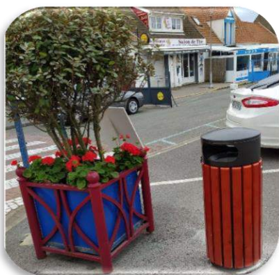
25 nouvelles poubelles

Plusieurs aménagements ont été imaginés et mis en œuvre dans les plus brefs délais