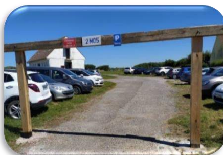
Ouverture d'un parking grande affluence sur le site de l'ancien camping de la corniche