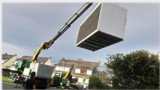
Un module a été installé pour accueillir la nouvelle cantine

Enfin des subventions ont été obtenues pour nous aider à améliorer la sécurisation des abords de l'école. (Ralentisseurs, panneaux, potelets...)