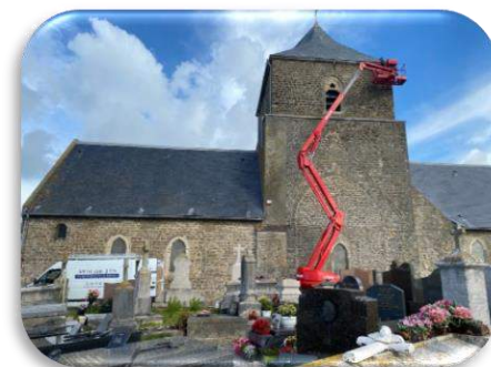
Travaux en toiture de l'église

D'autres travaux sont en voie de réalisation.