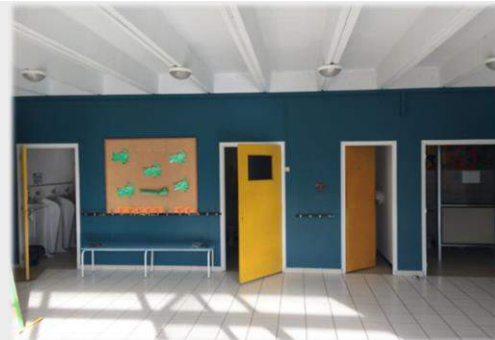
La salle de motricité a été repeinte