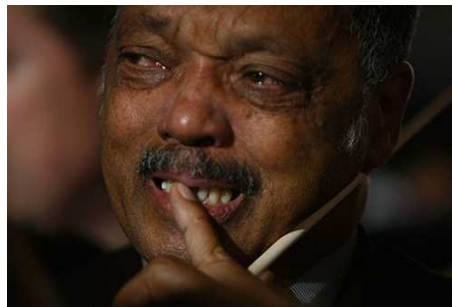
Jessie Jackson le jour de l'investiture de Barack Obama

Pour certains américains qui ont vécu l'Amérique Ségrégationniste, l'élection de Barack Obama a été la réalisation du rêve de Martin Luther King. Le révérend Jesse Jackson, un proche de Martin Luther King n'a pas pu retenir ses larmes lors de l'investiture de Barack Obama, avouant même après qu'il ne croyait pas que ce jour viendrait de son vivant.