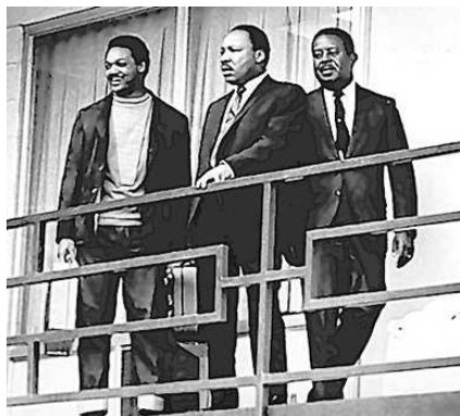
A gauche, Jesse Jackson, au milieu, Martin Luther King (la veille de la mort de sa mort 3 avril 1968)

Nombreux sont les américains qui retrouvent un peu de Martin Luther King en Barack Obama lors du discours « Yes we can » dans lequel il emploie l'épiphore « yes we can » à la fin des phrases. Ce n'est pas non plus un hasard si celui-ci choisit le Lincoln Memorial pour son discours d'investiture en 2009. Discours au cours duquel il rendra hommage à Martin Luther King