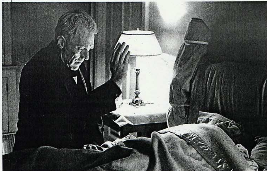
Le père Merrin (Max von Sydow) entreprend d'exorciser Regan (Linda Blair)