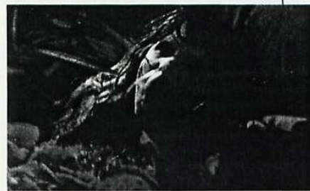
Regan est possédée.

Regan semble possédée par une force anormale et la statue de la Vierge qui se trouvait dans la chapelle du collège voisin est profanée. Burke Dennings, le metteur en scène qui dirigeait Chris, meurt dans des circonstances mystérieuses après avoir été seul avec Regan. Le lieutenant Kinderman qui mène l'enquête en arrive à la conclusion que Regan est l'auteur de ce meurtre. Chris décide alors de faire exorciser Regan qui se livre durant ses crises de possession à d'abjects sacrilèges. Deux prêtres vont accomplir l'exorcisme: le père Karras et le père Merrin, qui a fait des recherches archéologiques en Irak. Après que le père Merrin ait été terrassé, le père Karras se sacrifie et fait pénétrer le démon en lui-même puis se jette par la fenêtre. Libérée, Regan retrouve son état normal et perd tout souvenir de ce qui lui est arrivé.