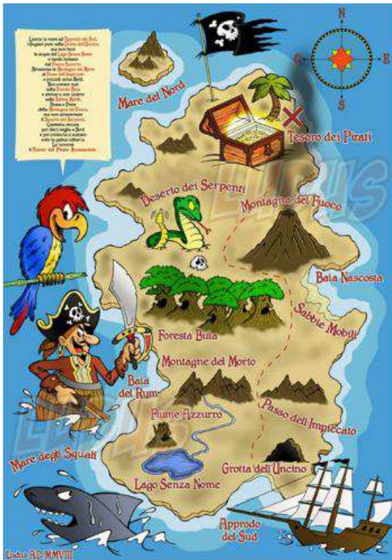
CARTE AU TRESOR