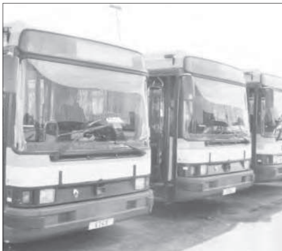
Voici les autobus qui vont révolutionner la Sotra.

« 50 autres autobus de la même marque qui viennent renforcer le parc. A en croire le premier responsable de la compagnie, ces mastodontes de type R312 et Agora standard allient qualité de construction au confort des usagers. » («L'expression», 8/11/2011). La satisfaction à peine dissimulée, le délégué de la SOTRA peut pérorer dans