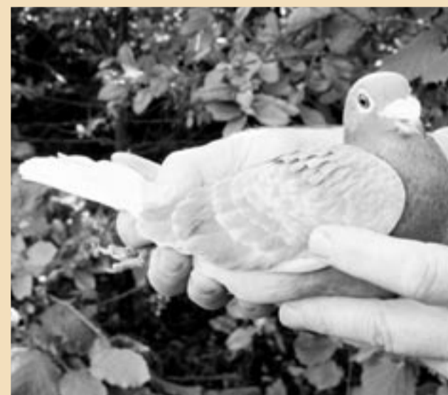
Le 093, un fils du Dikke Donkere , un petit-fils du Goeie Rooie .

La mère du 093 est une fille par son père du D'N Goeie Rooie (18 prix sur 19 dans les overnacht chez Saarloos) et une petite-fille du premier national Barcelone Looymans de 1993 croisé avec les Peiren .