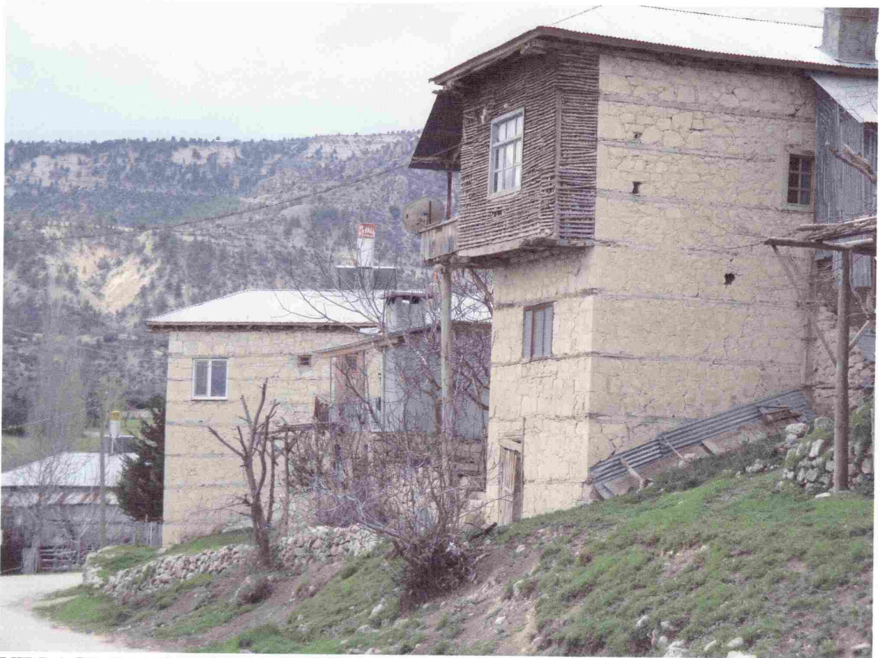
VILLAGE DANS LA MONTAGNE VERS ERMENEK

Le 7 avril , jeudi « persembe », nuit extra dans les abricotiers, nous prenons la direction de Silifke, tout à coup la vallée ce transforme en gorge très étroite, bel endroit. A un moment donné nous bifurquons à droite, nous traversons la gorge et remontons sur le plateau vers Gülnar, magnifique campagne. Après un arrêt chez le boucher pour acheter du mouton, nous retrouvons la route de Silifke et la côte, Taurus, Adana, un gros orage au moment où nous commençons chercher un endroit pour dormir. Nous allons jusqu'à Karatas au bord de mer en quête d'un camping, trop tôt dans la saison, tout est fermé. Nous trouvons un restaurant en bord de mer qui nous permet de nous installer dans son parking, parfait, comme il est tard nous mangeons au restaurant.