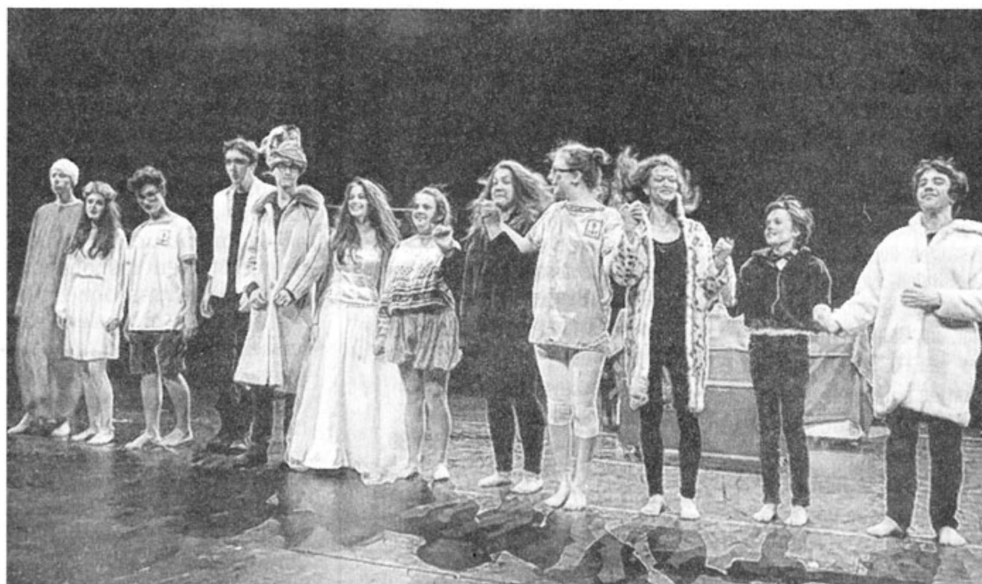
Animés d'un grain de folie, les adolescents ont salué le public venu nombreux.