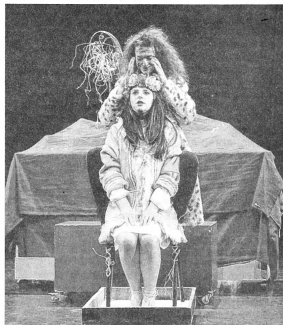
Alice, installée depuis longtemps au pays des merveilles, veut retrouver les partitions disparues et ramener les mélodies. Elle passe donc dans le monde de la reine rouge.