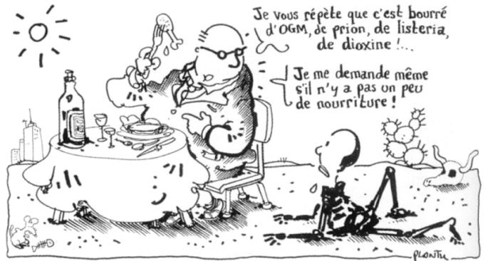
↑ Doc. 2 : Plantu, Le Monde , janvier 2002