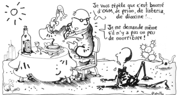
↑ Doc. 2 : Plantu, Le Monde , janvier 2002