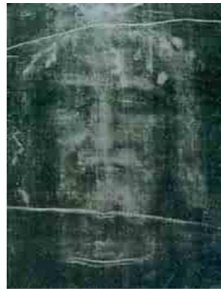
« Il est humble et monté sur un âne » Zacharie Comment s'éveiller, franchir sans humilité, sans se prosterner devant Celui qui Est ?

« 19:30 Quand Jésus eut pris le vinaigre, il dit: Tout est accompli. Et, baissant la tête, il rendit l'esprit.