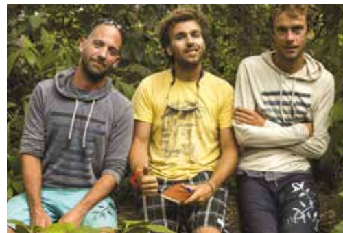
L'équipe de LOST IN THE SWELL

Rendez-vous samedi 6 avril pour découvrir le résultat !