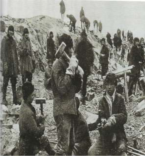
Construction du canal reliant la mer Blanche à la mer Baltique (1931-1933). Les détenus soumis au travail forcé réalisent cet ouvrage dans des conditions extrêmes. Ce chantier fait 60 000 victimes sur 250 000 détenus.

De 1936 à 1938, des milliers de procès truqués permettent d'éliminer les opposants à Staline. « Au cours de ce procès, il a été établi, démontré et prouvé avec une minutie et une exactitude exceptionnelles, que les droitiers 1 , trotskistes 2 , [...] bourgeois, nationalistes et leurs pareils, ne sont qu'une bande d'assassins, d'espions, de terroristes et de saboteurs sans idéal ni principe, un tas puant de fumier humain, de criminels qui se sont vendus aux services secrets ennemis. Dans notre grand pays, malgré l'abondance de ressources, nous manquons soudain tantôt d'un produit tantôt d'un autre. La faute en incombe précisément à ces traîtres. »