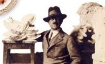
▲ Mathurin Méheut posant parmi ses sculptures.