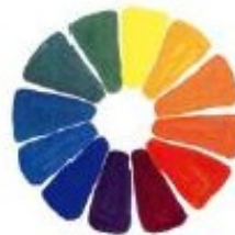
▲ Le Cercle chromatique. C'est le passage des couleurs claires vers les couleurs forcées.