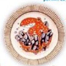
▲ Assiette Fleuve et pousse-pieds du Service de la Mer. Mathurin Méheut. Musée Mathurin Méheut

Quelles sont les œuvres dans le musée qui t'indiquent que Méheut était un décorateur ?