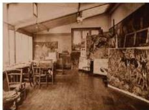
▲ L'atelier de l'artiste Mathurin Méheut, rue d'Alleray - Paris.