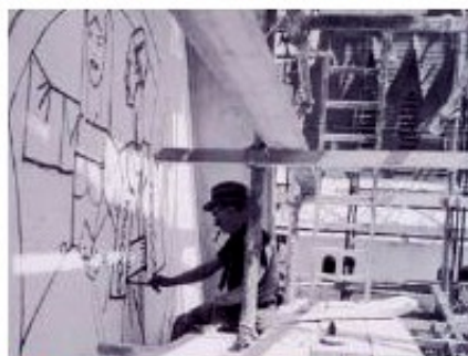
▲ Mathurin Méheut travaillant au décor du grand fronton du pavillon de la Bretagne en 1937. (Archives Musée Mathurin Méheut)

Quelle est la différence entre un croquis et une peinture ?