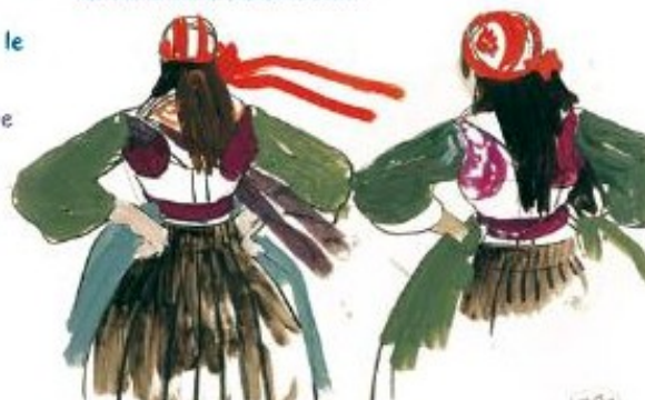
▼ Fillettes de Plougastel, Mathurin Méheut, Musée Mathurin Méheut, ADAGP Paris 2010.