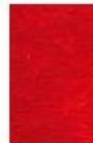
▲ Aplis de rouge.

Méheut utilise beaucoup la technique de l'aplat* et du cerne*.