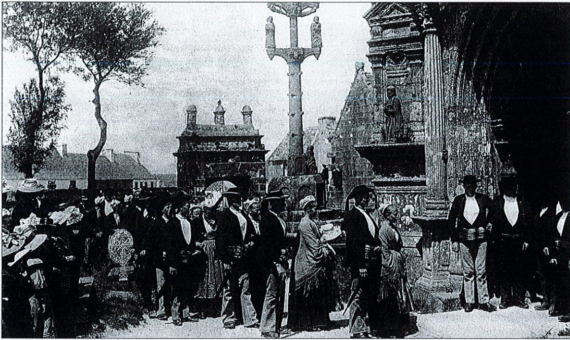
Une noce en Bretagne, 1920.