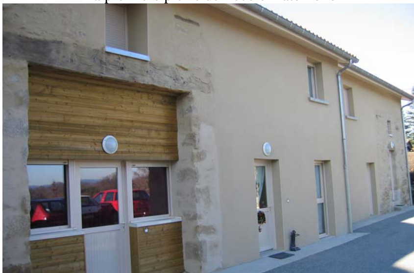
Les HLM de Senon