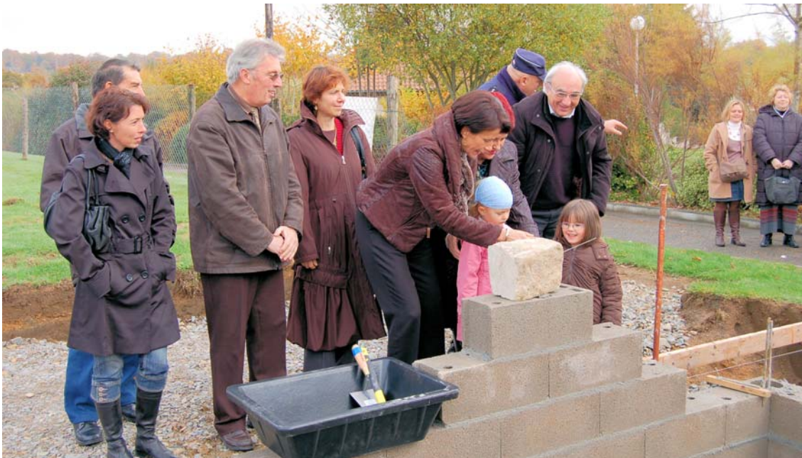
La première pierre de l'école maternelle

Des actions ont été aussi engagées pour le renforcement des liens de vie et de solidarité entre tous les habitants : amélioration des conditions d'accueil des élèves des écoles avec la mise en place d'ateliers spécifiques au sein de la garderie municipale, mise en place en mairie depuis novembre de permanences régulières de l'assistante sociale les deuxièmes et quatrièmes jeudis de chaque mois et accompagnement de la toute nouvelle association « les jeunes d'antan » qui réalise tous les jeudis après midi des ateliers en direction des personnes âgées isolées.