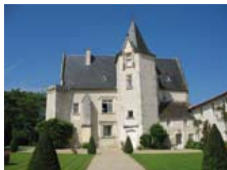
Château de Meux

Découverte du site troglodytique municipal, et au détour d'une grotte, « rencontre avec les plus célèbres troglodytes en chair et en os ! » ; animation pour découvrir les plus fameux habitants des grottes, de Marie Guichard au capitaine du Régulus en passant par le Pasteur et le terrible Cadet le Naufrageur ! : sam et dim 10h-12h/14h-18h (2,50€ / - 5 ans : G)