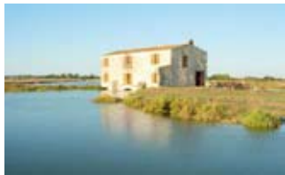
Moulin des Loges

Rens. : 05 46 85 98 41 ou 05 46 47 35 77