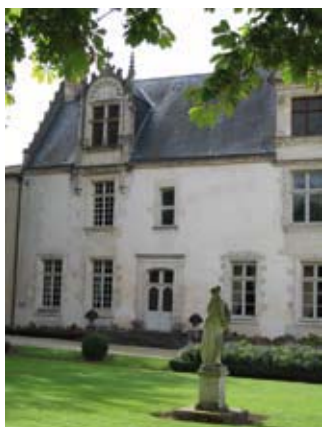
Château de Beaulon

Visite libre des extérieurs du château (1480-1510) avec le Jardin Bleu (création Atelier Acanthe et Gilles Clément), le sous-bois à l'anglaise, les Fontaines Bleues (sources naturelles de coloration bleue), le pigeonier de 1740, ses 1 500 boulins et son échelle tournante, la cour d'honneur (construite sur une nécropole gallo-romaine) : sam 9h-12h/14h-18h et dim 10h-12h/14h-18h (4,50€ / - 15 ans : G)