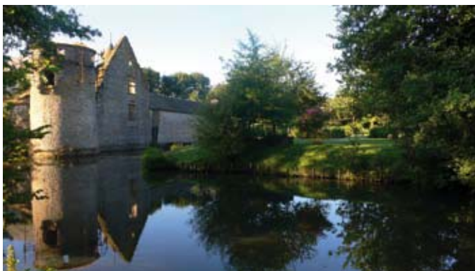
Beaulieu-sous-Parthenay - Château de La Guyonnière