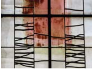
Détail de vitrail de Louis-René Petit à l'église St-Sauveur-de-Givre-en-Mai à Bressuire