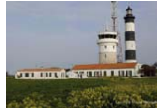
Sémaphore de Chassiron

Visite guidée d'une emprise de la Défense (Marine Nationale) avec exposition des différentes missions militaires et de service public : sam et dim 10h-12h/14h-18h (G) (10 pers. max./groupe - sur présentation d'une pièce d'identité - accès déconseillé aux personnes à mobilité réduite ou présentant une déficience cardiaque et aux femmes enceintes - Les visites peuvent être interrompues à tout moment si une opération survient)