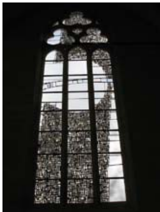
Église Ste-Hérie - Vitrail de Gérard Lardeur

Visite libre du temple et des églises (documents à disposition du public) : sam et dim 14h-18h ; visite libre du château avec un diaporama sur Jacquette de Montbron « Une femme parfaite, une héroïne riche de tous les dons, architecte des châteaux de Montbron et de Matha » ; exposition « Les couleurs de l'Antenne » : sam 14h-18h et dim 10h-12h/14h-18h ; démonstration d'escrime et de jeux médiévaux : dim à 14h (G)