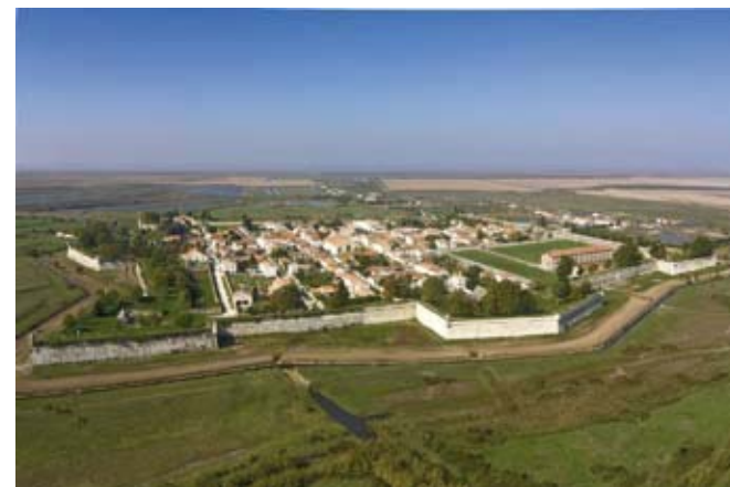
Vue aérienne de Brouage

« Sur le chemin des mottes », circuit accompagné (1h) avec découverte