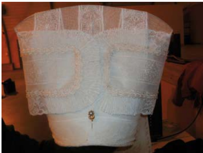
Saint-Sorlin-de-Conac - Coiffe

permanentes du musée (histoire et ethnographie de l'île d'Oléron) et visite de l'exposition temporaire « [R]évolution littorale » qui explique la genèse des paysages de l'île d'Oléron et du trait de côte : sam et dim 10h-12h/14h-18h (G)