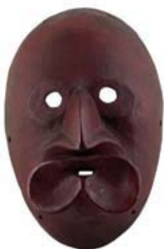
Musée du Nouveau Monde - Masque Sénégal © Max Roy

du public avec les témoins de l'activité maritime de La Rochelle. Visite de 2 navires : le France 1, navire météorologique stationnaire, et le remorqueur de haute-mer le St-Gilles. Chants de marin - animations matelotage - jeu de visite « Alors Raconte ». Les visiteurs reçoivent un livret qui les invite à un circuit de rencontres avec des témoins à bord des navires. Sam et dim 10h-18h30 (dernière admission 17h30) (3€ / Enfants : 2 € / - 4 ans : G)