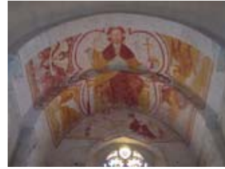
Peintures murales de l'église Notre-Dame du Pin