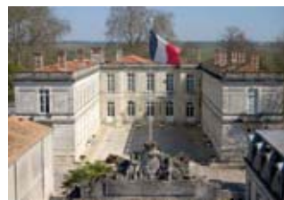
Vue aérienne de l'Hôtel de commandement

Rens. : 05 46 88 30 31 ou 05 46 88 30 33