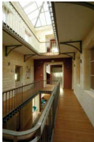
Archives départementales - Site de Jonzac © S. Curty

Visite guidée en compagnie du meunier ; festival « Courants d'air 2012 » : sam 10h-12h/14h-18h (G) ; atelier de décoration de bannières, fabrication de cerfs-volants, initiation et démonstrations de cerfs-volants géants : sam à 14h (G)