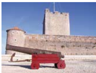
Fort Vauban

Sam et dim 10h-12h/15h-18h30 (1€ / Enfants : G)