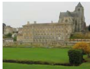
Abbaye royale

Visite libre des bâtiments conventuels, collections, salle des archives avec exposition de documents, parcs et jardins : sam et dim 10h30-12h/14h-17h (G)