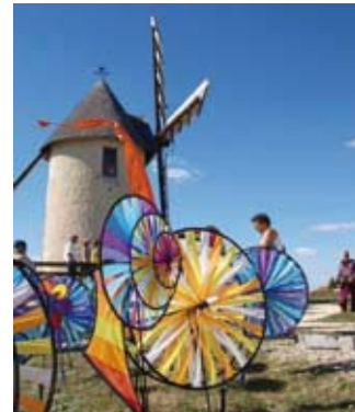
Jonzac - Moulin à vent de Cluzelet - Festival Courant d'air

découverte de légendes, croyances, expressions et proverbes autour de l'histoire du pain : sam 10h-12h/14h-18h (G) ; concert : sam à 18h (G)