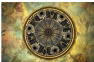
Coupole du théâtre

Après 5 ans de travaux, le théâtre de la Coupe d'Or va enfin ouvrir ses portes. Visite guidée par un guide-conférencier du service du patrimoine (toutes les 30 mn) : vend 14/09 10h-11h30 et 14h-16h, sam 10h-12h et 14h-16h30 et dim 10h-12h et 14h-17h30 (places limitées - inscriptions à partir du 01/09) (G)