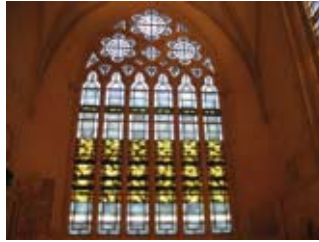
Vitrail de Jean-Jacques Fanjat à la chapelle des Cordeliers de Parthenay