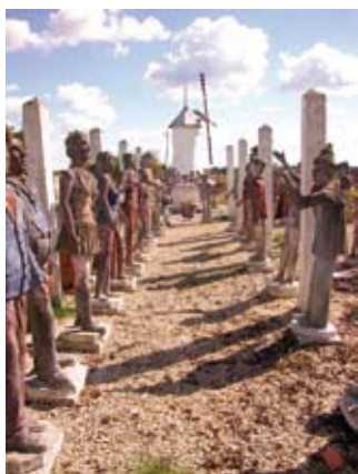
Jardin de Gabriel © Brigitte Montagne

sonnages de contes et bien d'autres encore : sam et dim 15h-18h (G) Spectacle de la Comédie de l'Éperon « Soirée poésie » autour des statues : sam 21h (5€)