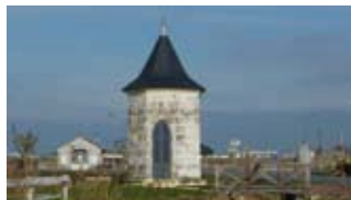
Le Gua - Kiosque

Rallye pédestre avec questionnaire sur les « traditions charentaises » : dim à 15h30 (G)