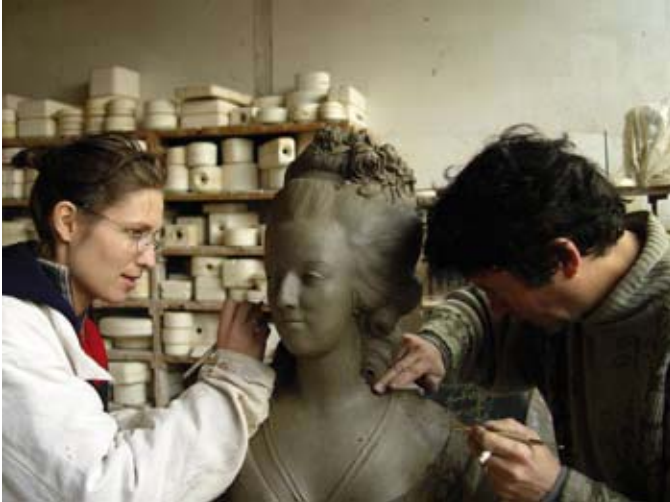
Marie-Antoinette d'après Leconte réalisée par l'Atelier Campo © Atelier Campo