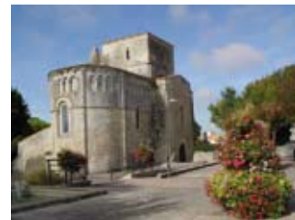
Vaux / Mer - Église St-Étienne

Visite guidée à la découverte de la réserve naturelle et de sa diversité biologique (canards, petits échassiers des rivages et des marais, passereaux...) : dim à 15h (2h15) (7€ / 11-17 ans : 6€)