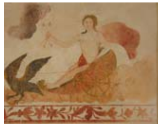
Peintures murales

Sam et dim 10h-19h (TR : 2,50€ / - 14 ans : G)