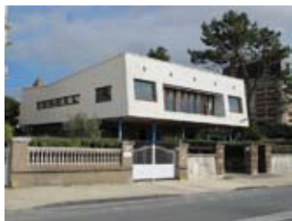
Royan - Villa Ombre Blanche

Rens. et réservation : 05 46 22 55 36 ou 06 14 74 09 65