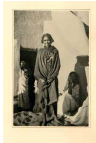
À In-Salah, photographie de la 1 ère traversée du Sahara (1922-1923)

Voir le circuit « Les coulisses de l'histoire » (cf. Abbaye Royale)