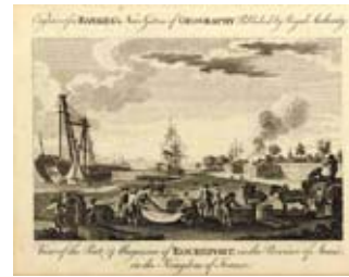
Gravure anglaise du port de Rochefort milieu XVIII e s.

Visite libre de la salle de lecture et des salles d'exposition du Service historique de la Défense (SHD), installé dans l'ancienne caserne des équipages de la flotte construite sous le Second Empire (salle de lecture présentant des ouvrages et périodiques de la bibliothèque, spécialisée en histoire maritime et navale et dans l'histoire des régions du littoral atlantique / exposition permanente proposant des gravures, maquettes, uniformes et objets de marins, dont une vitrine sur Pierre Loti) ; exposition « Rochefort, voyage maritime. Les Rochefortais