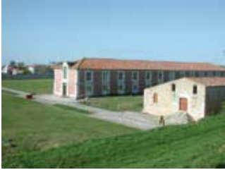
Hiers-Brouage - Halle aux vivres © Syndicat Mixte de Brouage