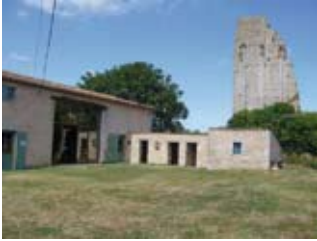
St-Sornin - Maison et Tour de Broue