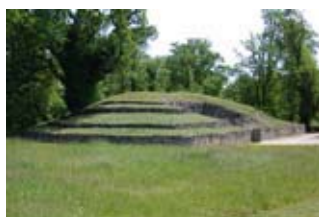
Tumulus © Musée des Tumulus

Sam et dim 10h-18h30 ; visite guidée : sam et dim à 11h00, 14h15, 15h15, 16h15, 17h et 17h45 (G)