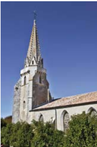
Montée au clocher

Montée au clocher (toutes les 30 mn) : sam et dim 14h30-17h30 ; visite libre de « La Souillarde » (40-42 rue de la République) : sam et dim 15h-18h (G)