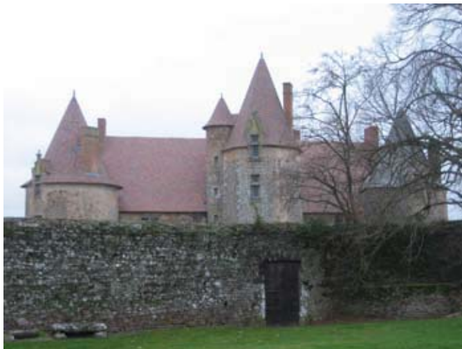
Château de La Chapelle-Bertrand

5 place de la Coutume Rens. : 05 49 35 81 04 Circuit à pied ou en vélo « Les richesses cachées du patrimoine de