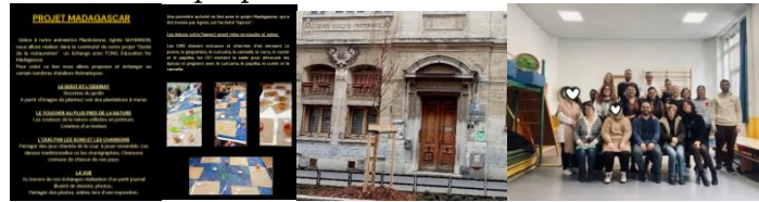
Façade de l'école et l'équipe (tous les agent, animateurs, entretien, cuisine, gardienne)

Le 14 12 23 Présentation du projets à tous les enfants de l'école, des maternelles aux primaires. La projection des photos et vidéos, de repères géographiques, d'aborder la faune, la flore, les transports. De laisser le temps aux enfants de questionner et même de proposer.