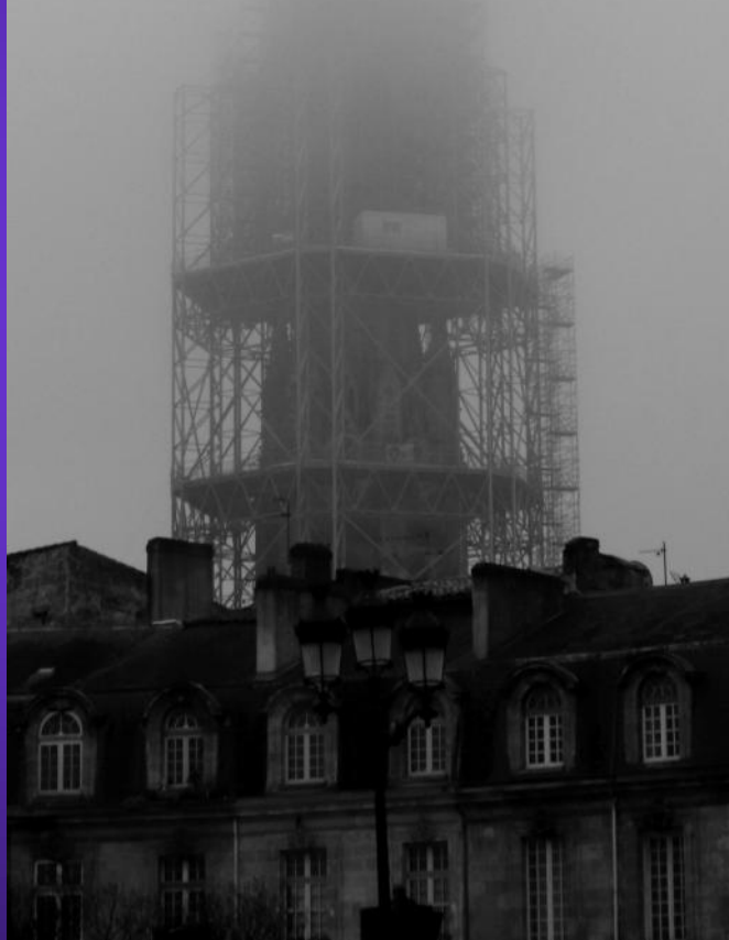
Derrière la brume apparaîtront, un jour, les forces de Paix !