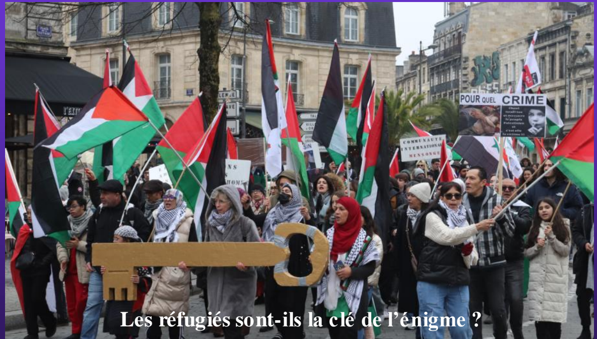
Les réfugiés sont-ils la clé de l'énigme ?