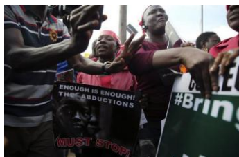
Manifestation à Lagos, lundi, pour la libération des jeunes lycéennes otages de Boko Haram.

Lors des questions au Gouvernement du 7 mai 2014, le député socialiste, François Loncle, a interrogé Laurent Fabius, Ministre des affaires étrangères, sur l'enlèvement de jeunes filles par la secte Boko Haram.