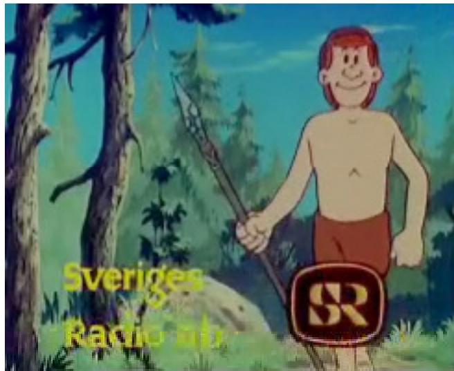
G - 40 000 | Emergence de l'homme moderne (Homo Sapiens) – Cro Magnon