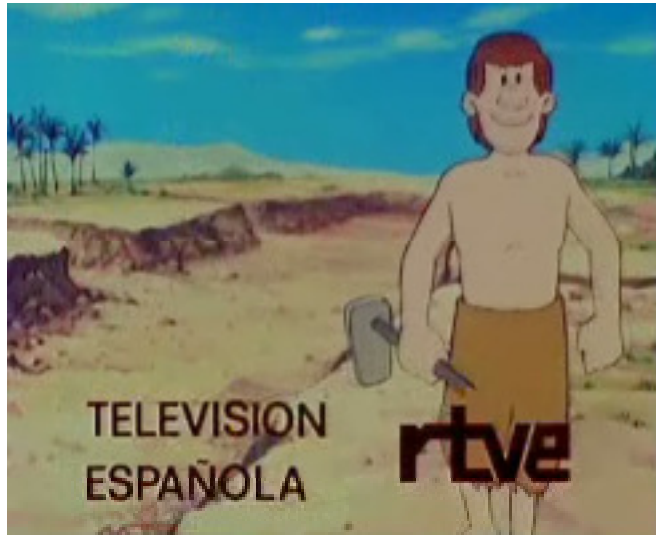
I - 8 000 | Naissance de l'agriculture (Mésopotamie)