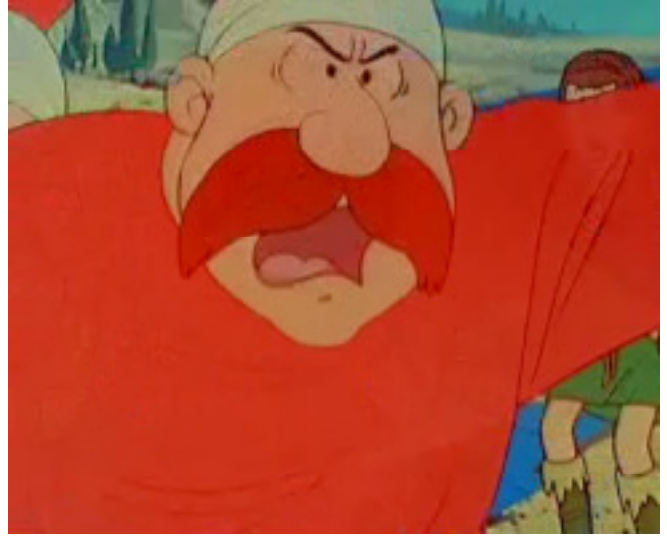
E 5 eme siècle | Dislocation de l'Empire romain