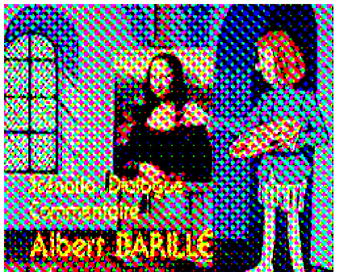
J 1503-1507 | Léonard de Vinci peint la Joconde - Renaissance