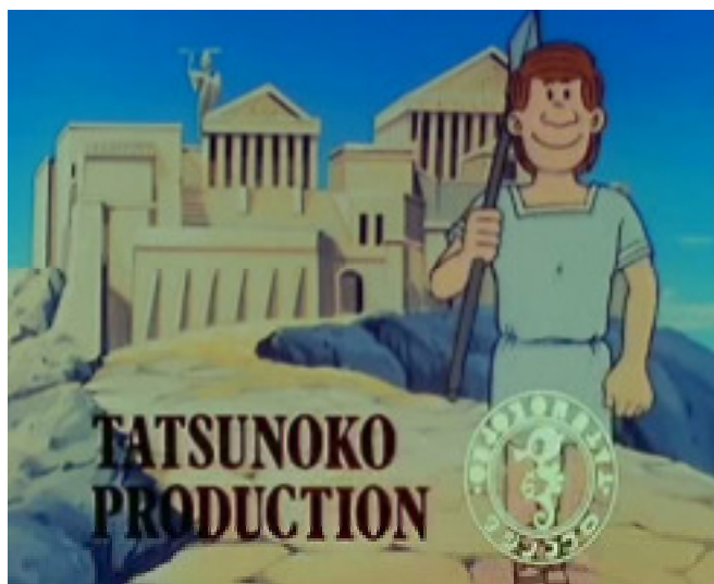
B - 500 | Apogée d'Athènes (siècle de Périclès, le Parthénon)