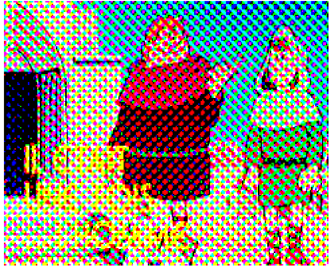
K 13 eme siècle | Louis IX (Saint Louis) - Le temps des cathédrales