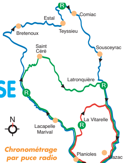
La Vélotoise (dénivelé : 2060 m) 133 km