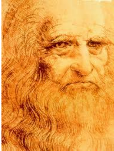
Leonard de Vinci