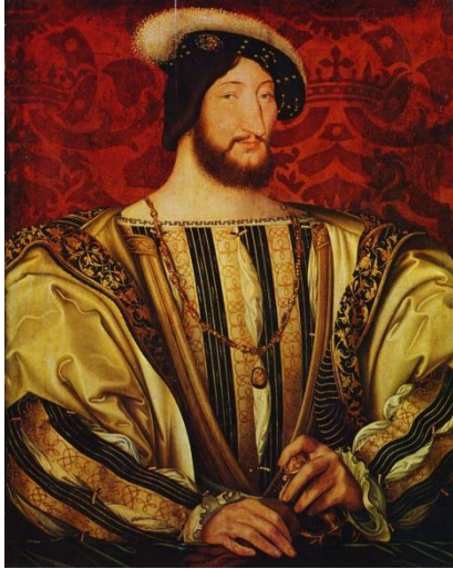
François 1 er