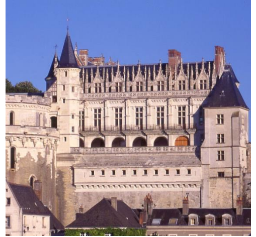
Le château d'Amboise

1. Quand les rois de France viennent-ils s'installer dans la vallée de la Loire ?