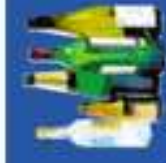
Les bouteilles et bocaux en verre

Nous nous débarrassons sans y penser de nos déchets... Pourtant, certains d'entre eux sont des matériaux que l'on peut recycler ou valoriser. Ils peuvent servir à fabriquer de nombreux objets ou de l'énergie que nous utilisons tous les jours.