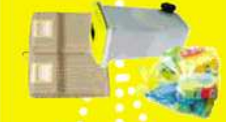
CENTRE DE TRI

Les bouteilles, films et sacs en plastique, briques alimentaires, boîtes métalliques et cartons