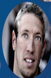
Le parrain Alain Bernard Champion Olympique Et membre du Team EDF

Une nuit de solidarité de 18h00 à minuit