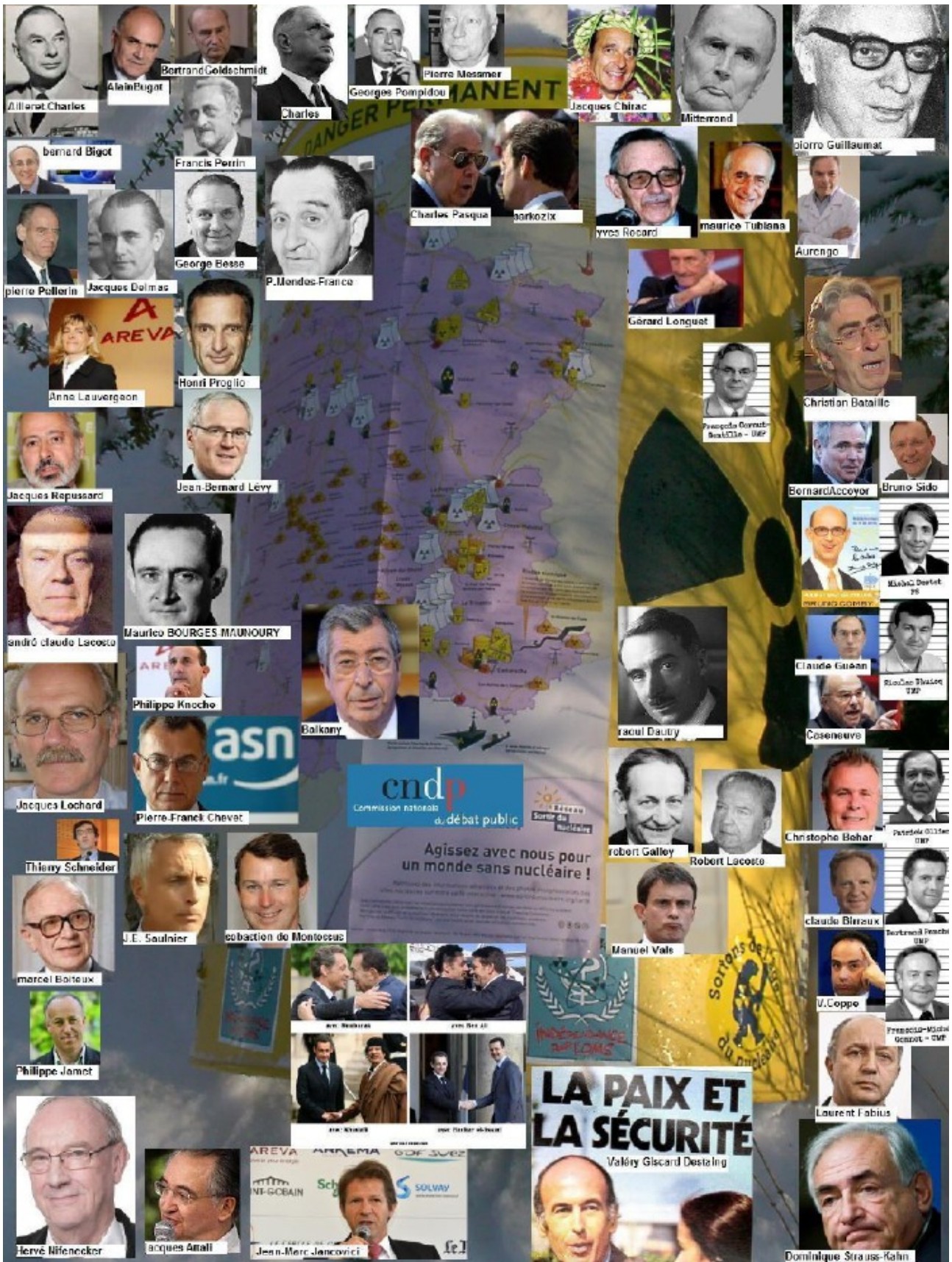
Le réseau VULCANUS

C'est bien de faire des procès en déontologie contre la pub d'EdF ou de la voiture et vélo électrique mais on parle bien ici de crime, c'est anxiogène certes, c'est pourtant bien un crime contre l'humanité et SDN, Greenpeace ont tous les éléments sur cette imposture et cette prévarication ils ont