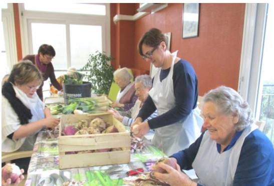
« Epluchage de légumes pour pot au feu à l'occasion du téléthon »

En décembre dernier, les résidents de l'EHPAD de Preuilly ont apporté leur aide à l'organisation du Téléthon dans la commune. L'EHPAD a accueilli dans ses locaux le concours de belote qui a réuni de nombreux joueurs. Le samedi matin, les résidents ont épluché avec entrain les légumes du pot au feu en compagnie de bénévoles du comité des fêtes (une résidente a d'ailleurs exprimé sa satisfaction en disant : « c'est chouette, on se sent utile ! »). Des productions de décors de Noël, de chutney de figues et de bijoux fantaisie sont venues alimenter le stand de vente au profit du téléthon.