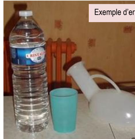
Exemple d'erreur possible

Beaucoup de personnes ont participé à cette journée qui fût une pleine réussite.