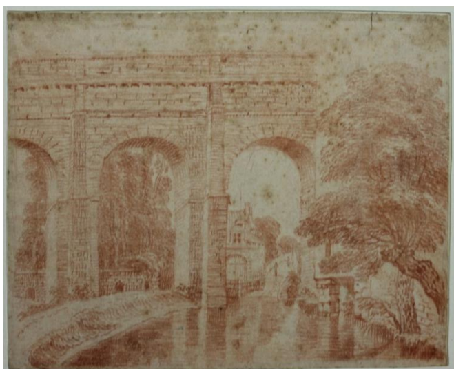
Notre dessin « Vue de l'aqueduc d'Arcueil »

L'exposition « À l'ombre des frondaisons d'Arcueil. Dessiner un jardin du 18e siècle » sera présentée jusqu'au 20 juin.