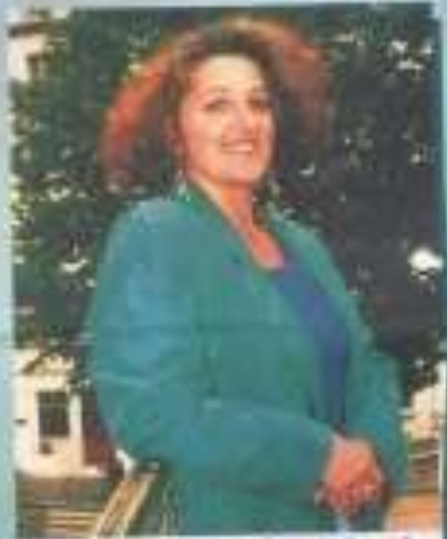
Marie-Anne Isler Béguin Vice-Présidente du Parlement européen