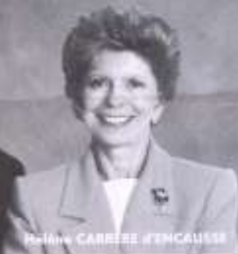
Hélène CARRÈRE d'ENCAUSSE

Le 12 juin, vous allez rendez-vous avec la démocratie en Europe. Vous pouvez engager l'Europe sur une nouvelle voie en choisissant les représentants de la France au Parlement de Strasbourg. Nous devons voter pour que l'Europe se démocratise et mette fin aux excès de la bureaucratie.