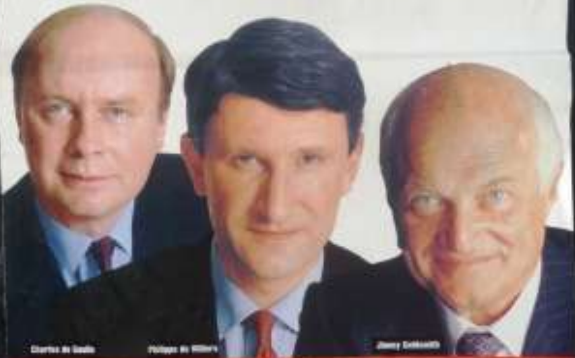
Charles de Gaulle

Philippe de Villiers, Jimmy Goldsmith, Charles de Gaulle