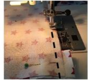
Piquer en point droit le long de la fermeture.