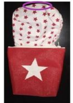
Fermer ensuite le trou de la doublure par un point droit.