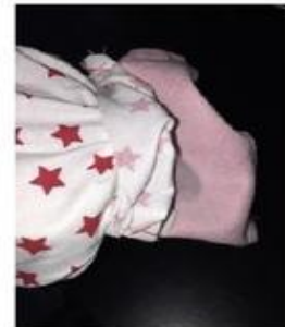
Retourner comme une chaussette en passant par le trou de la doublure.