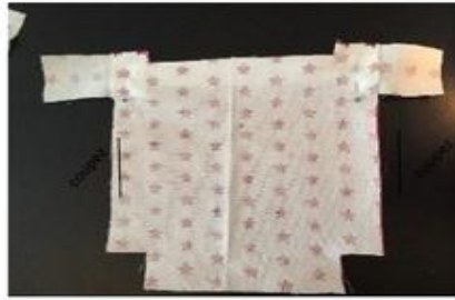
Couper les excédents de tissu des pattes.