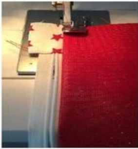
Piquer en point droit le long de la fermeture pour faire une surpiqure.