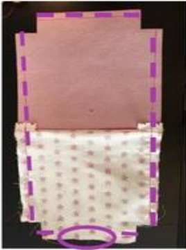
Tissu extérieur endroit contre endroit, doublure endroit contre endroit. Coudre le tour en point droit sauf les angles et le bas de la doublure.