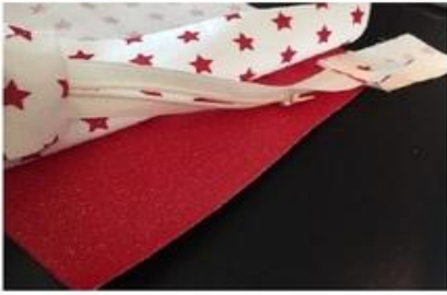
Positionner ensuite la doublure.