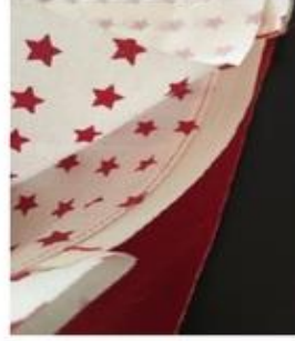
Faire le 2 ème côté de la même façon. Tissus endroit contre endroit, fermeture entre les 2 tissus, curseur en contact avec tissu extérieur. Piquer puis faire la surpiqure .