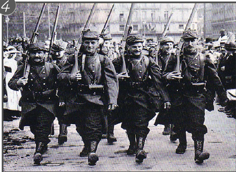
Photographie de français mobilisés partant à la guerre, sous les encouragements de la population

Le 3 août 1914, l'Allemagne déclare la guerre à la France et le 4 août, le Royaume-Uni déclare la guerre à l'Allemagne.