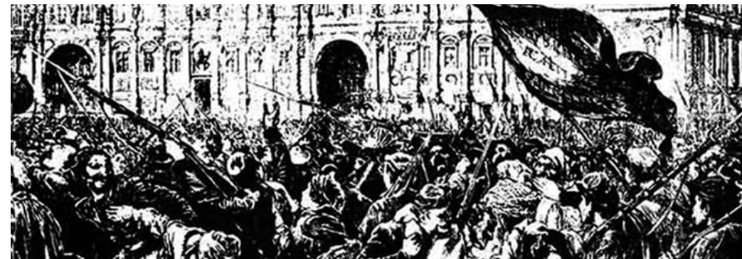
La Commune de Paris, Hôtel de Ville, 1871

19h30 - Salle des fêtes - Mairie du 11 e