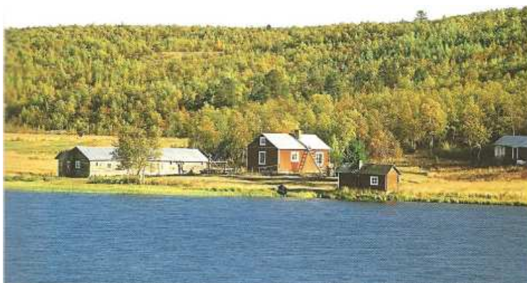
Doc. 3 : Des zones faiblement peuplées (Finlande).

9. Dans quelle zone de peuplement ce paysage se situe-t-il (Doc. 3) ? Aide-toi du Doc. 1.