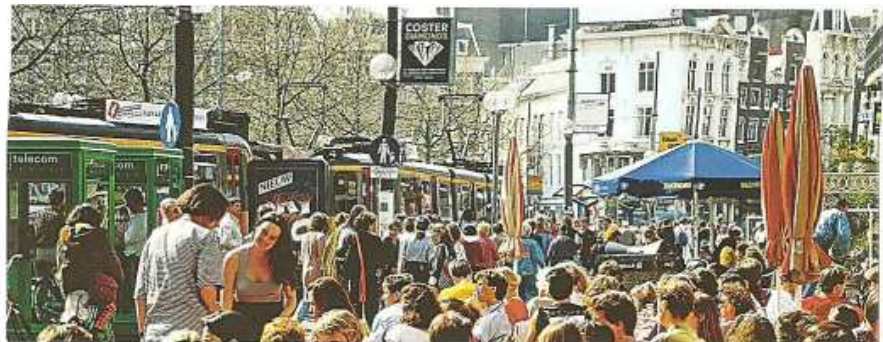
Doc. 2 : De fortes concentrations de population (Amsterdam, Pays-Bas).

8. À quoi vois-tu que le peuplement est très dense dans cette région ?