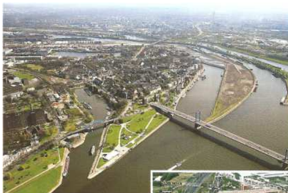
Doc. 3 : La vallée du Rhin (Duisbourg, Allemagne).