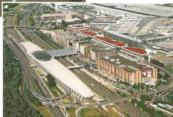
Doc. 4 : L'aéroport international de Francfort (Allemagne).