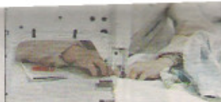
De plus en plus, les salariés restent dans la douleur...

chent des explications fournies par les nombreux intervenants interrogés dans le film : le sentiment des salariés d'être interchangeables, la suppression des collectifs de travail et l'explosion de « l'instantanéité », avec des tâches qualifiées non plus d'urgentes mais de « TTU » (très très urgentes).