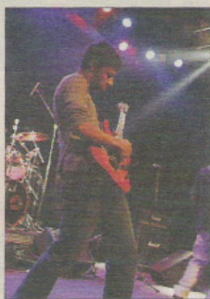
Gran Mèr Kal dopée à l'électricité ce soir au Palaxa.

seuls à faire la bombe : les percussions de Son de Kèr seront aussi de la fête. Une fête pas seulement musicale d'ailleurs puisque, nous dit-on, « ce sera l'occasion de faire des découvertes musicales et visuelles avec l'implication d'étudiants, que ce soit dans les arts du cirque, la musique et les effets lumière... » Bigre ! Sachez enfin que l'entrée sera gratuite pour toute personne déguisée ou habillée de blanc. Et les déguisements les plus originaux seront récompensés.