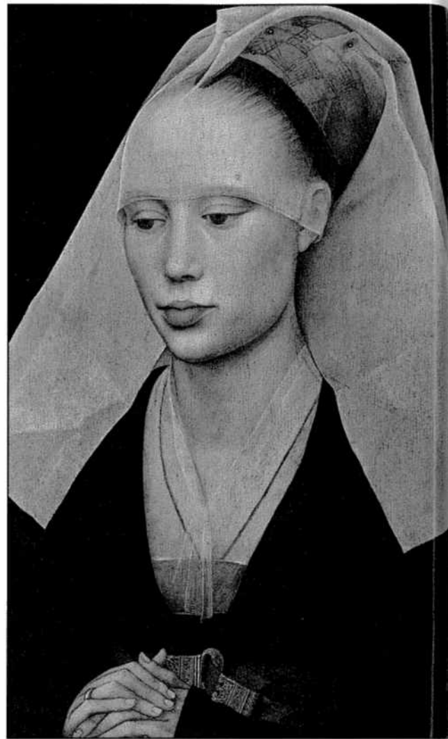
Portrait de dame – Rogier Van der Weyden v 1460 – Huile sur panneau de chêne, Andrew W. Mellon Collection, National Gallery of Art, Washington.

Elissa, un des personnages du roman de Boccace (4), désapprouve ainsi ses compatriotes en précisant toutefois : J'ai honte à le dire, car en critiquant les autres je me critique moi-même . Elle commence par décrire les femmes ornées, peinturlurées, bigarrées , qui sont telles des statues de marbre, muettes et sans