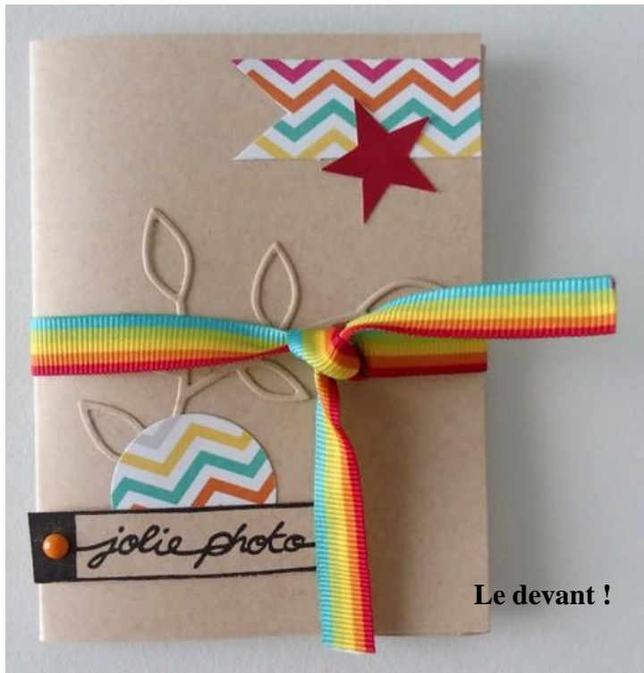
Le devant !