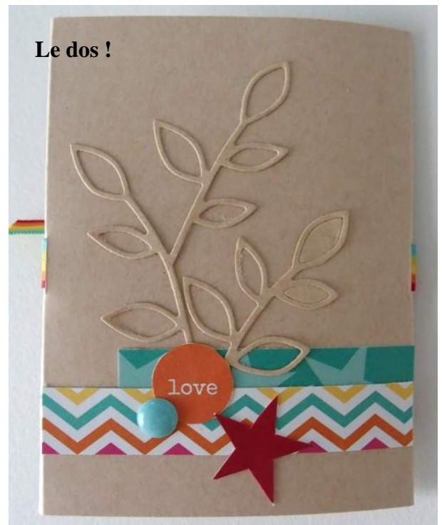
Le dos !

N'oubliez pas de nous montrer vos réalisations sur le forum ! Bon scrap !