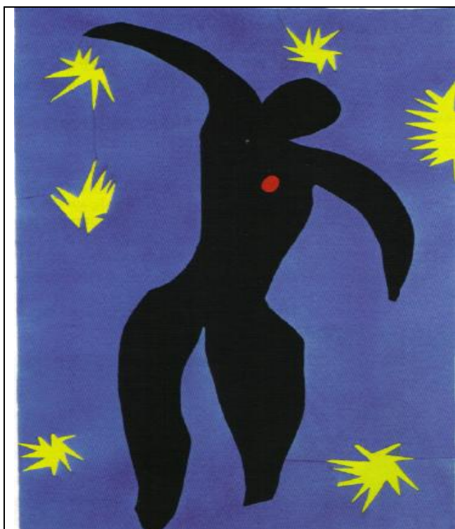
Henri Matisse, Icare , planche au pochoir (VIII), issue du livre Jazz , Tériade, 1947.

En 1947, le peintre Henri Matisse a 78 ans. Cet immense artiste ne peut plus peindre car une grave maladie l'en empêche. Peu lui importe, sans peintures et sans pinceaux, il invente la technique des papiers découpés et renouvelle son art.