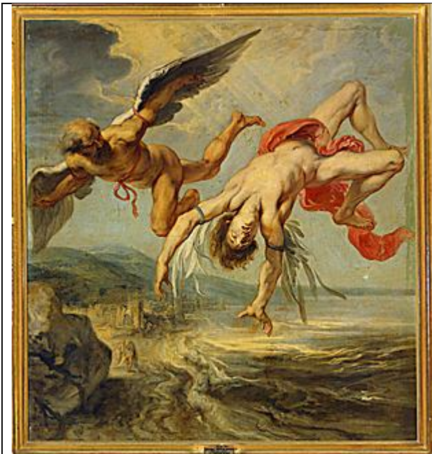
Jacob Peter Gowy, musée du Prado, Madrid. D'après une peinture de Rubens, La Chute d'Icare , 1636.