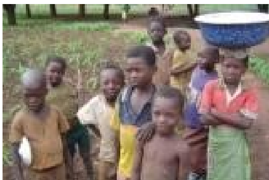
Les enfants sur la route entre Koumra et Lai