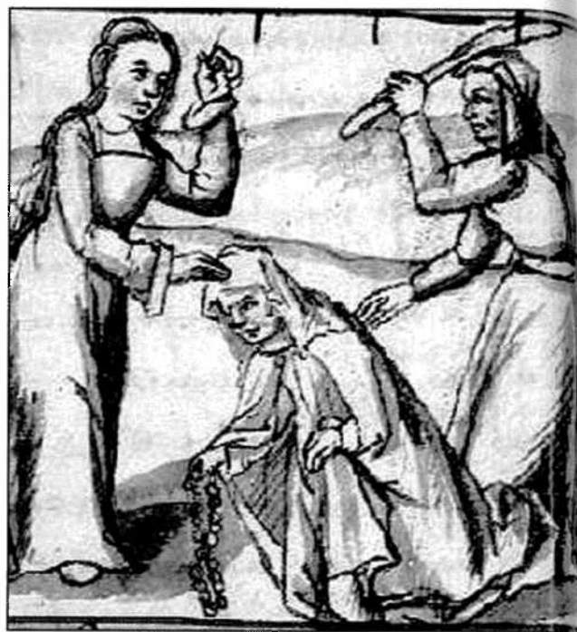
Beauté et laideur combattant chasteté, Ms P A 25 F 67, Roman de la rose, Guillaume de Lorris, Jean de Meung, Bibliothèque municipale de Lyon, XV e .

La description de l'homme avançant dans l'âge est assez piquante. De façon humoristique (10), il est dit qu'il n'a guère à se plaindre puisqu'il ne fait que changier sans perdre : la rougeur de sa face lui va au bout du nez, celle du vit lui monte es yeulz, la grosseur de ses cuisses lui descend aux genoulz. S'il n'a plus les goutes fresches, il n'a que trop des seques, et la soupce de ses rains lui descend ou membre ; se sa chevelure lui change, c'est de or a argent ou de moreau a grison. Les transformations physiques ainsi évoquées n'ont d'égaies que les considérations triviales où la roideur de son membre lui va en l'eschine, la grosseur de son cul lui va ou ventre. Quant à ce qu'il est encore capable de faire, s'il souloit regarder a deux yeulz, il voit a quatre ; s'il vouloit jouser, danser, chanter, luittier, saillir, il adrece au bien faire et juge ou loe les meilleurs ; se par bas a tenu du pallein, monté lui est es mains et ou chief ; s'il souloit pissier au plus loing, il pisse au plus près ; s'il souloit estre perilleuz par devant, ores est dangereuz par derriere ; et se tant ne mengue comme souloit, il se recoevre au boire.