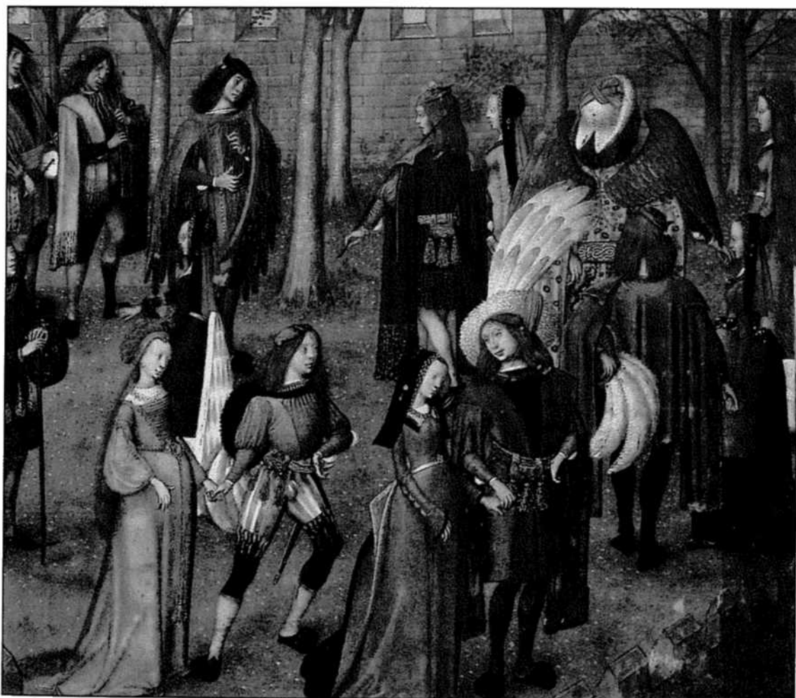
La Carole de Déduit, Roman de la rose, Londres, British Library, Ms. Harley 4425, fol. 14 v. vers 1490.

Chasteté est mise à mal par les deux vertus. Beauté est par nature représentée comme une femme jeune, la robe élégante et près du corps, le cheveu libre, contrairement aux deux autres qui portent la coiffe.