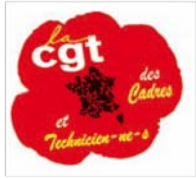
Schéma d'une vie de femme ICTAM