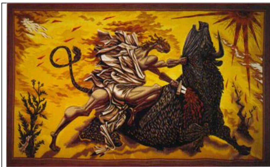
Thésée et le Minotaure , Marc Saint-Saëns, tapisserie d'Aubusson, 1943. Paris. Musée national d'art moderne, Centre Georges-Pompidou.

Exercice 1 : A partir du site : http://classes.bnf.fr/heros/index.htm