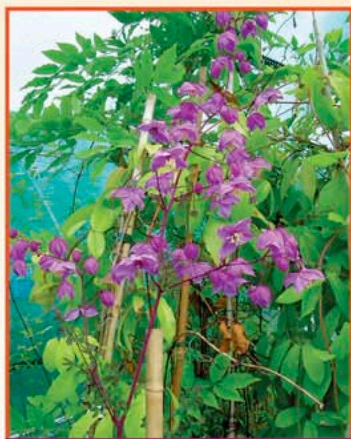
Thalictrum delavayi var. decorum