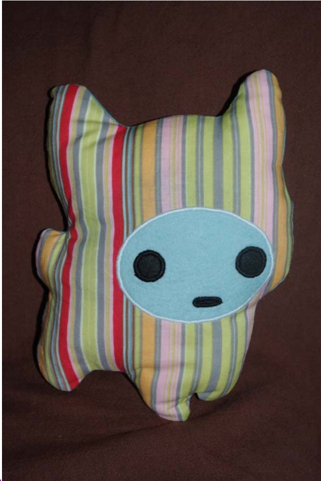
Tout seul ...