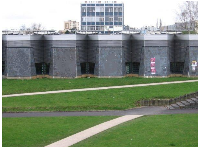
bibliothèque universitaire de Rouen

Nous rappelons que la Région a intégralement financé la construction de la bibliothèque de l'Université du Havre. La valeur totale de l'opération était alors de 13.4 millions d'euros (hors TVA). La construction de cette nouvelle BU à Rouen représenterait une dépense de 25 à 30 millions d'euros.