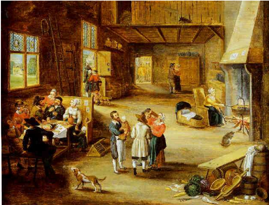
Auberge au temps de nos ancêtres

Ne servait-il point de vin de messe pour l'abbaye de Fécamp dont dépendait le monastère d'EVECQUEMONT à l'emplacement du château du prieuré ?