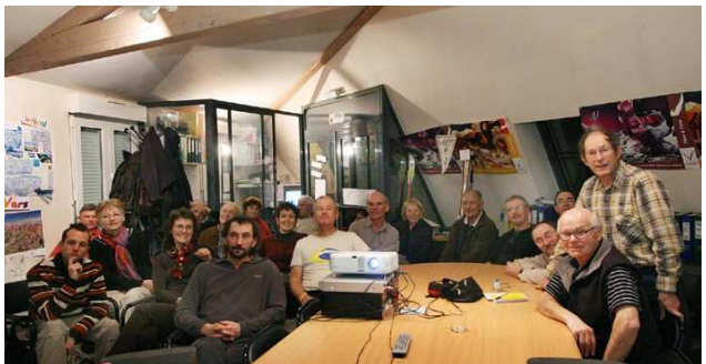
Les membres de PVC 47 découvrent les images du film.

Les acteurs ont pu visionner enfin les images tournées depuis 2 ans grâce à la récupération des séquences déjà montées... ce qui les a ardemment motivés pour