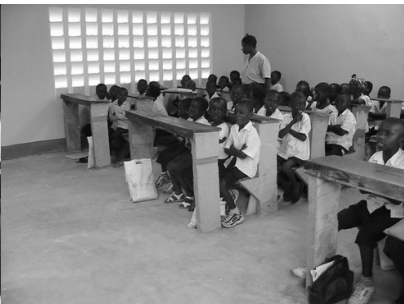
Kelasi oya PAIDECO atongi