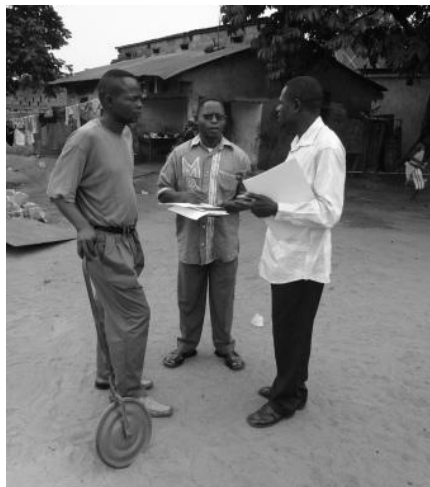
Les responsables de l'ONG Umoja visitent la parcelle de leur futur atelier

Dans l'immédiat, un premier atelier va ouvrir ses portes à proximité de la maison communale de Kimbanseke. Dans un second temps, deux autres ateliers devraient s'installer. L'un à Kimbanseke, l'autre à Kisenso. Chacun d'eux devrait être capable de traiter plus de six tonnes de déchets plastiques tous les mois et par la même occasion créer une dizaine d'emplois directs. Cela fait près de vingt tonnes de déchets plastiques retirés des rues chaque mois... et 2.000.000 FC de revenus totaux pour les collecteurs de sachets.