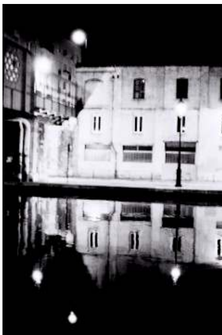
Reflets sur le canal de l'Ourcq, 24 x 36 cm.

Certaines des photographies sont reproduites dans le recueil d'OLIVIER MANSEAU, Noctambule intra muros publié aux éditions Filigrane.