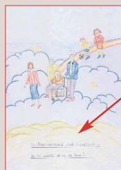
2ème prix Michèle Ordener

"La BIENVILLANCE, c'est l'amélioration de la qualité de vie pour tous !"